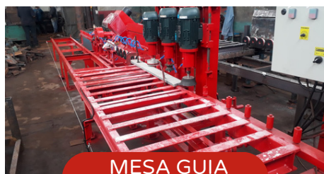
MESA GUIA AUTOMÁTICA