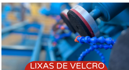
LIXAS DE VELCRO ATÉ 12CM