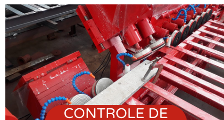
CONTROLE DE VELOCIDADE

Com um design robusto e flexível, ela oferece diversos acabamentos e pode ser totalmente adaptada às suas necessidades específicas.